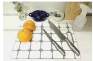
調理器具・食器などに