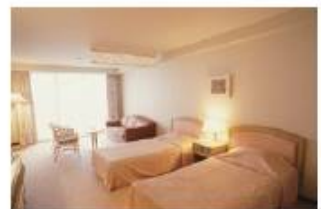
寝具、ソファ、カーテンなどに