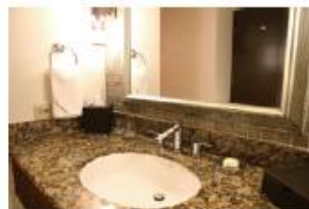
トイレや洗面所などに