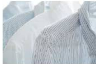
大切な衣類のカビ、ダニ、対策に