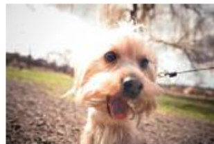
大切なペットの身の回り用品に