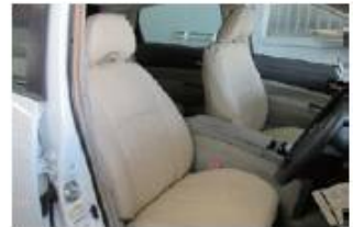
大切なお車のシート、ハンドル、エアコンに