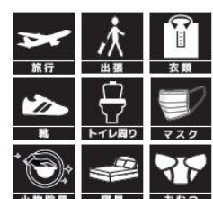
AAS 50mlスプレータイプ 内 容 量：50ml