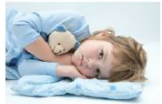
大切なお子様のベビーカー、おもちゃなどに