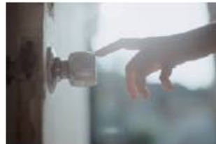
ドアノブや手すりに