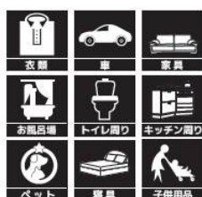
AAS 300mlスプレータイプ 内 容 量：300ml